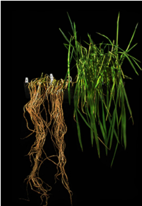
これら基礎研究から、Su

b1A遺伝子の秘密が分子レベルで明らかとなった。原理的には、その能力を「普通のイネの品種」にも寄与できるはずである。果たして、Sub1A遺伝子を導入したイネは、実際の東南アジアの農業地帯で洪水に耐えるのだろうか。インドやバングラデシュで広く栽培される「スワー